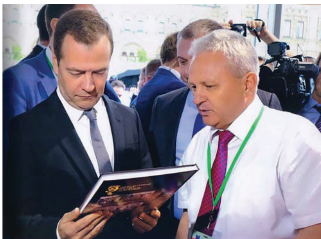
Дмитрий Медведев и директор Чувашского книжного издательства на книжном фестивале «Красная площадь»