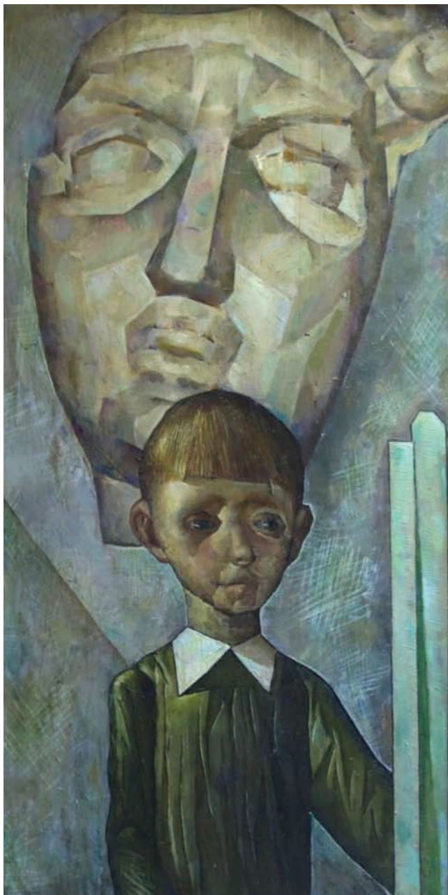
Л. Стуканов. «Мальчик с маской», 1970. Картон/масло. Частное собрание

ной известной ей причине, и свою фамилию. Так, немецкий малыш с русской фамилией приобрел свою вторую родину. Возможно, это обстоятельство послужило тому, что сокровенное искусство Графа объединило корни немецкого экспрессионизма и любимого им русского декаданса.