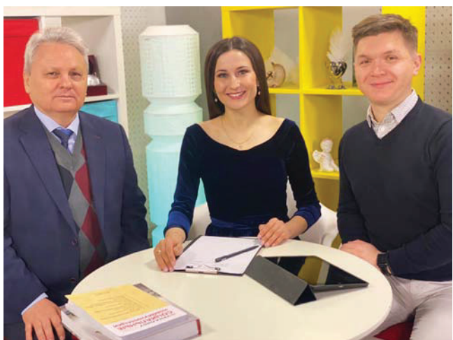
После прямого эфира на НТРК Чаваш Ен