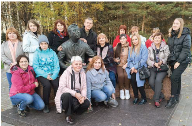
Смоленские журналисты на экскурсии. Фото на память у памятника Ю. Никулину. г. Демидов