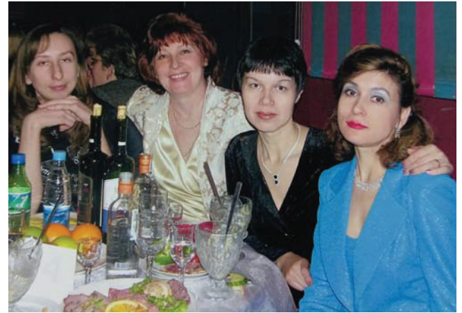
С коллегами газеты «Огни Енисея». 2011 г.

Так что еще целый год предстояло выпускать газету в Кежме, в старом-престаром, перекошенном здании со своей кочегаркой и пьяными кочегарами. В типографии — земляной пол. Обстановка в редакции — полное убожество! Просто плакать хотелось! Думала, все — тупик. Куда я попала? Как позволила себя обмануть?! Но и это, оказалось, еще не тупик.