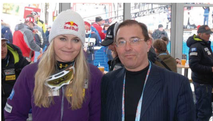
Фото в пресс-центре тестовых соревнований по скоростному спуску и слалому на Красной Поляне Кубка мира с одной из самых красивых участниц — одной из лучших горнолыжниц мира Линдси Вонн, 2012 г.