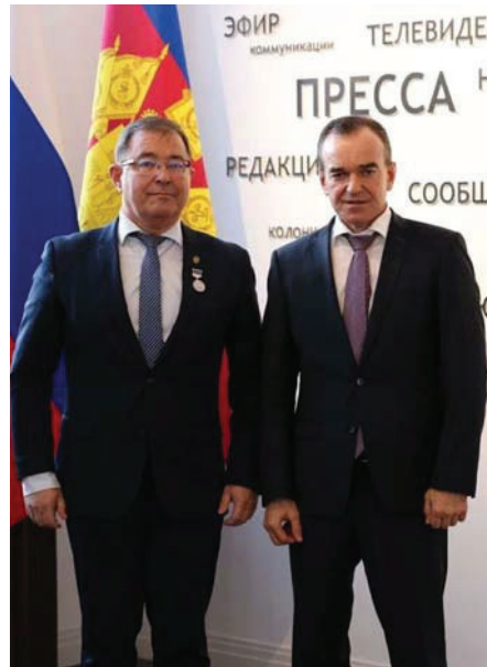
Губернатор Вениамин Кондратьев вручил серебряную медаль «За выдающийся вклад в развитие Краснодарского края». 2024 г.