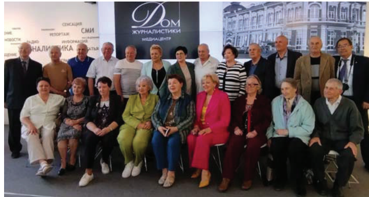
Дорогие мои райончики, ветераны журналистики, с которыми меня связывают десятилетия сотрудничества и искренней дружбы, 2024 г.