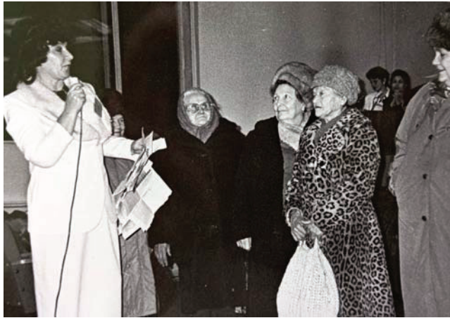
День подписчика. 2017 г.

ятной: новый город, новое место работы, многие люди знакомы по культуре и комсомолу. Коллектив редакции тоже знала: доводилось тесно сотрудничать. Как же я тогда заблуждалась!!! За 8 лет, что меня не было на родине, многое поменялось. Но это стало понятно только после переезда.