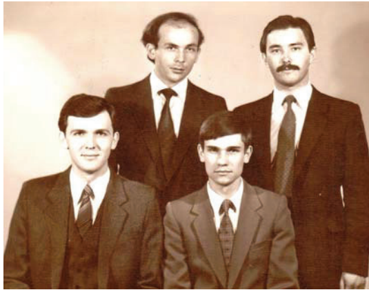
Выпускники исторического факультета КубГУ 1984 года (я во втором ряду справа)