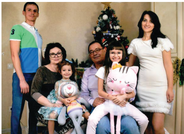
Моя семья — надежный тыл, радость и опора в жизни

смогли «вытащить» из-под глав районов, которые зачастую вели себя как местные князьки («кого хочу — милую, а кого хочу — казню»), газеты и тем спасли не одного редактора районки.