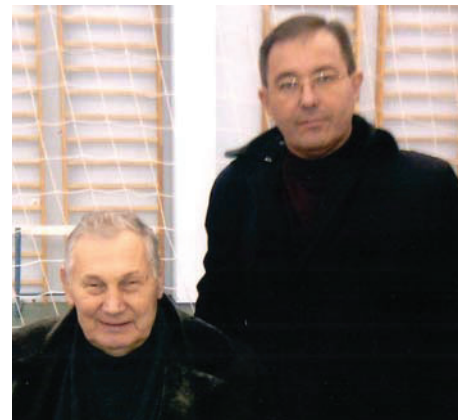
С трехкратным олимпийским чемпионом Александром Медведевым на открытии памятника И.М. Поддубному