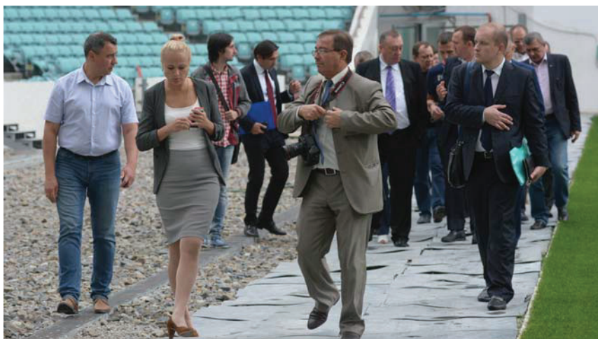
С делегацией Совета Федерации на стадионе «Фишт» во время его реконструкции, 2015 года