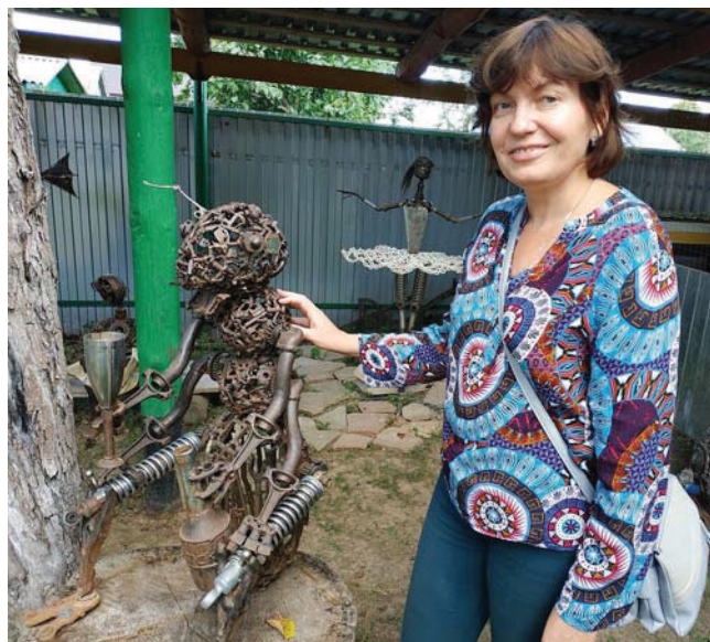
Таруса. Музей Жарова

Период предвыборной агитации. В это время, сами знаете, по редакции бегают много людей: представите-