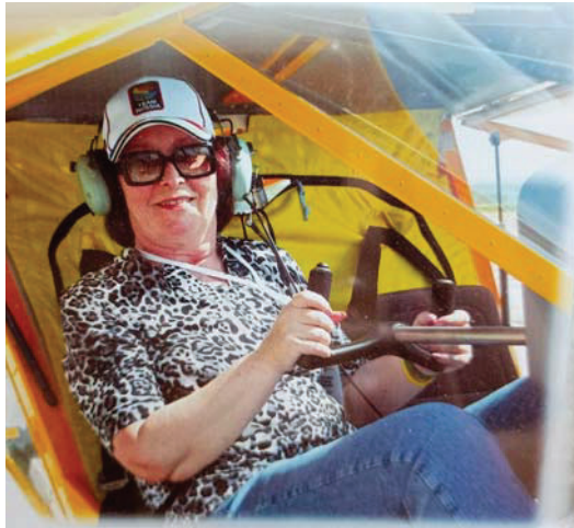
За рулем вертолета