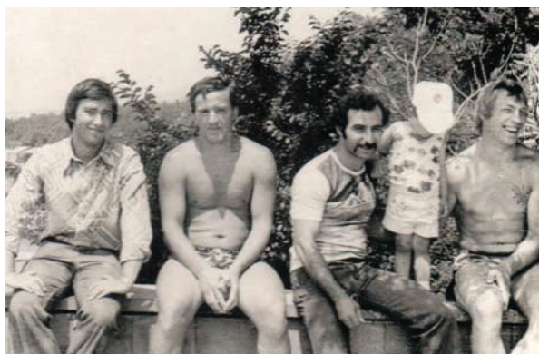
Со звездами советского хоккея Валерием Васильевым и Петром Природиным, 1978 г.