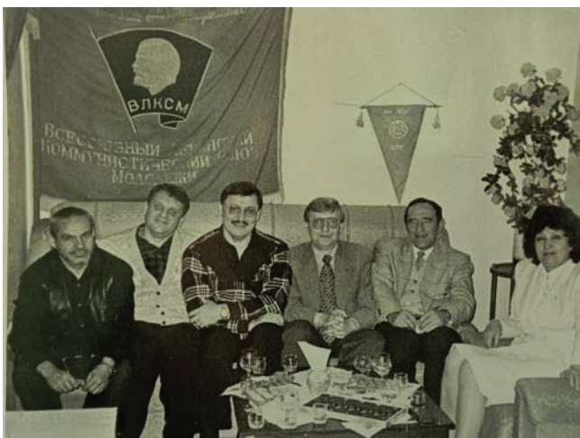
С секретарями комсомольской организации Дивногорска разных лет, 2000 г.