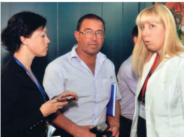
Обсуждение рабочих вопросов на форуме «Вся Россия» в Сочи 2008 г.