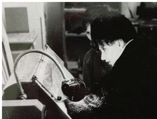
Редакция газеты «Советское Приангарье». Что-то поломалось, надо исправить

Нетрудно догадаться, что произошло потом. На должность секретаря был предложен мой коллега. После конференции поздно вечером с горя на пару с завсектором учета высушили полбутылки водки, закусывая сырыми яйцами. Наутро, ни свет ни заря, без предупреждения, униженная и оскорбленная, явилась пред изумленными глазами заворготделом крайкома партии с заранее подготовленной речью: «Я не буду работать с этим секретарем, отправьте меня куда угодно, готова работать даже инструктором».