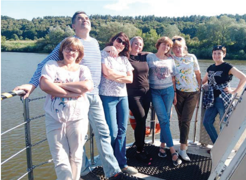
С редакцией на речной прогулке