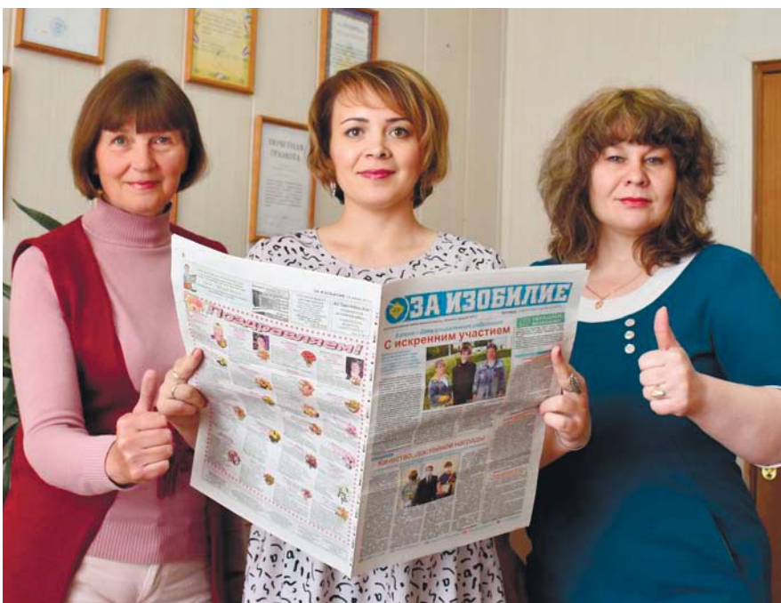
Автор (в центре) с коллегами

За два с половиной года, что идет спецоперация, в СМИ опубликовано немало моих очерков и статей, посвященных СВО. Вначале писала об отправке первых добровольцев и мобилизованных колпнянцев на фронт, затем делилась с читателями их рассказами с передовой, не обошла стороной тему женской любви и верности, а также волонтерства и всенародной поддержки наших бойцов