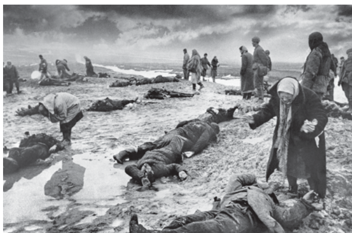
Дмитрий Бальтерманц. Горе.

Для Пикассо — это не всем понятная «Герника». А для меня, русского зрителя, это глаза — как зеркало изнеможденной души. Я всматриваюсь на этой уличной выставке в глаза еще не озверевших и не опьяневших от крови нациков образца 2014 года на Майдане.