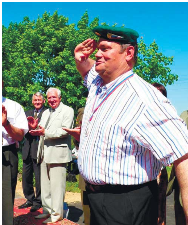
Экс-губернатор Пензенской области Василий Бочкарев.