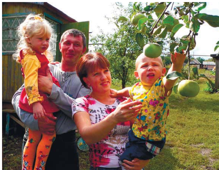
Ветка в кадре была своего рода его авторской подписью