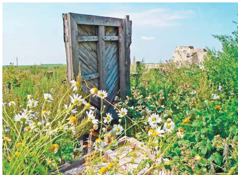
Вот моя деревня...