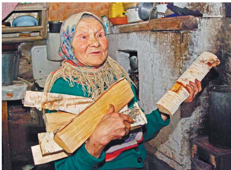
Иллюстрация к материалу «Последний праведник» — о последней жительнице умирающей деревни