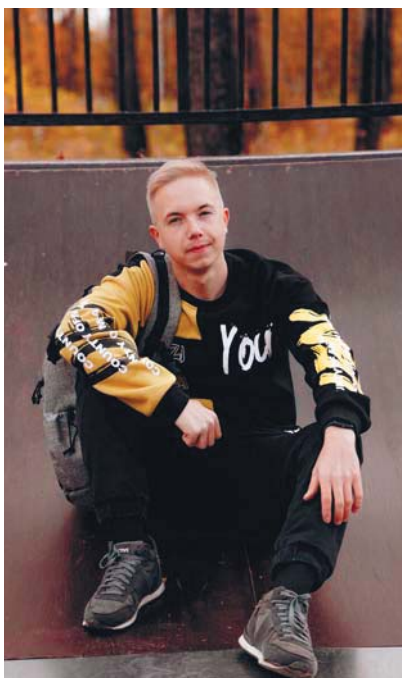
Победитель профессионального творческого конкурса форума «Вся Россия — 2024» в номинации «Лучшая операторская работа/работа фотографа» — 2-е место

Работаю в районке с февраля этого года. Читая местную газету и рас-