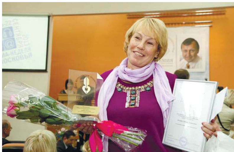
Лауреат региональной премии Виктора Мельникова 2013 г.