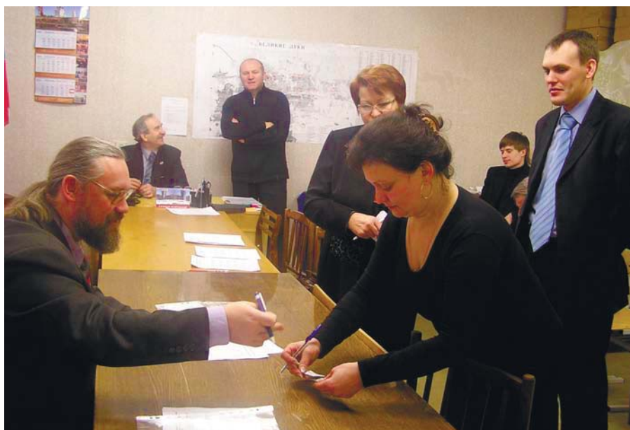
В ТИК идет жеребьевка по распределению печатных площадей в газете