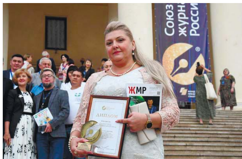
Победа во Всероссийском конкурсе на лучшее журналистское произведение Союза журналистов России

Невозможно сделать районную газету весомой и значимой, если у редактора нет эффективного контакта с