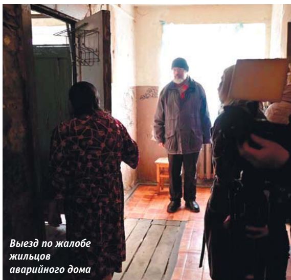
Выезд по жалобе жильцов аварийного дома