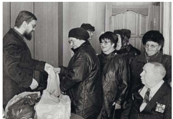
Награждение победителей лотереи-подписки