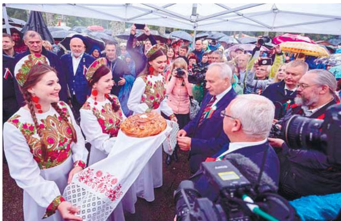
Хлеб-соль на Кургане Дружбы

Нужно соответствовать. Каждая из 49 моих книг, смею надеяться, не написана просто так, для простого самолюбования или, прости Господи, «самореализации», а чего-то хорошего в нашей жизни прибавляет.