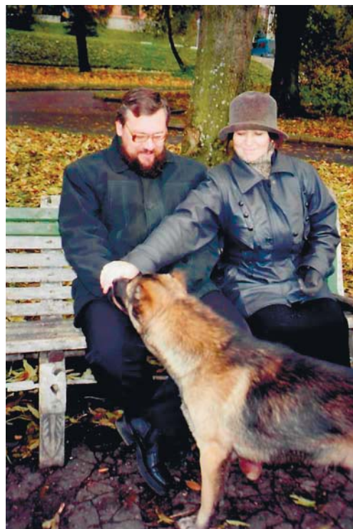
С журналистами хотят общаться все