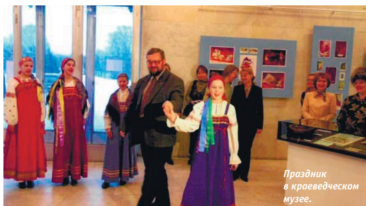
Праздник в краеведческом музее.