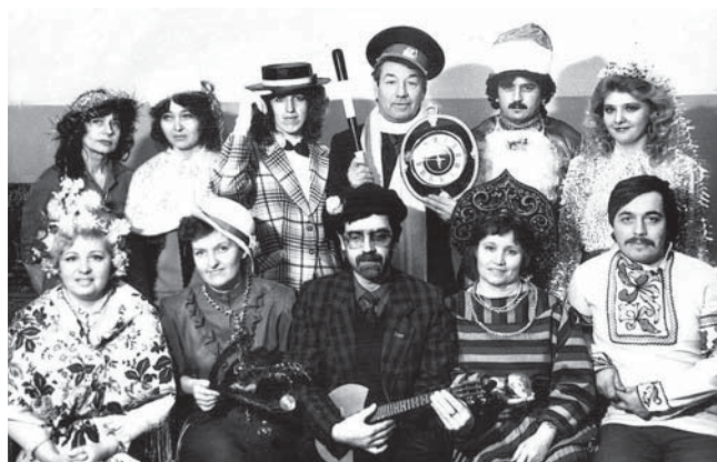
Первый мой редакционный коллектив — газета «Трудовая жизнь»

Более всего из тех лет мне запомнился как жанр рассказ. Это не тот, что из разряда «художественный». Это тот, что из разряда «ну очень публицистический». То есть история есть, а возможности написать про нее — нет. И ты пишешь рассказ. Изменяя фамилии героев, но оставляя фактуру. И не придержишься: это же, простите, художественное произведение, вымысел, так сказать, автора. А по истории-то все узнают, что про что. И правду можно рассказать, и подлеца назвать подделцом.