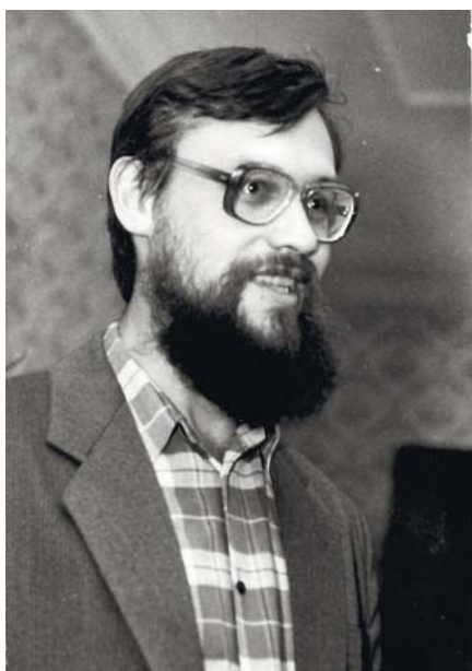
Выступление в библиотеке