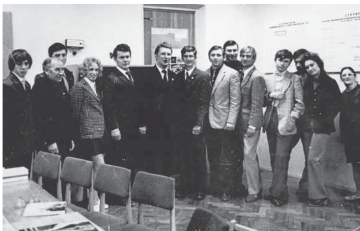
Корреспонденты молодежной редакции на приеме в городском комитете комсомола. 1980 г.