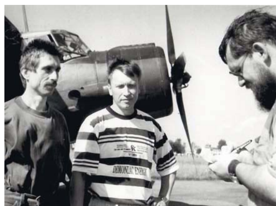
На аэродроме перед полетом