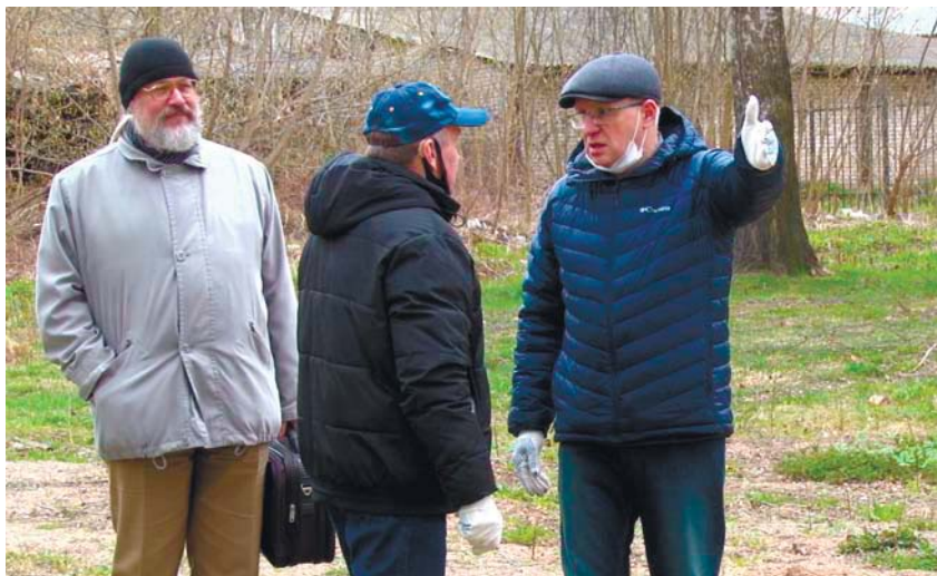
Во время весеннего месячника по благоустройству