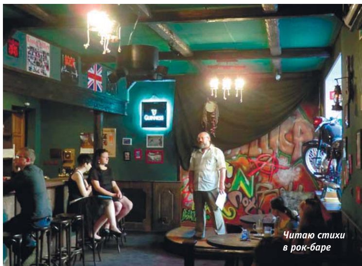
Читаю стихи в рок-баре