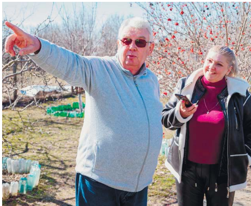
Когда уже влюблен в героя очерка