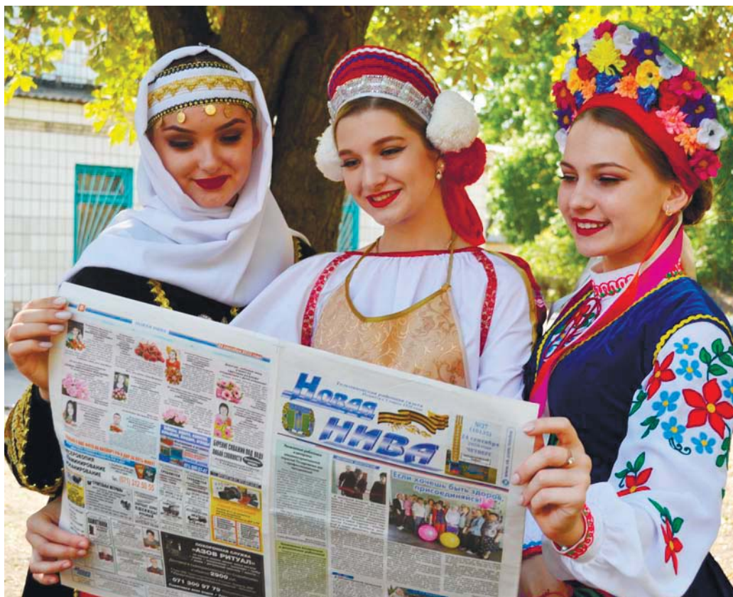
Сила газеты — в многонациональном единении

горело, оргтехника, мебель, машина исчезли бесследно.