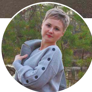
Победитель премии Нижегородской области «Журналист года 2023», спецноминация «Своих не бросаем»