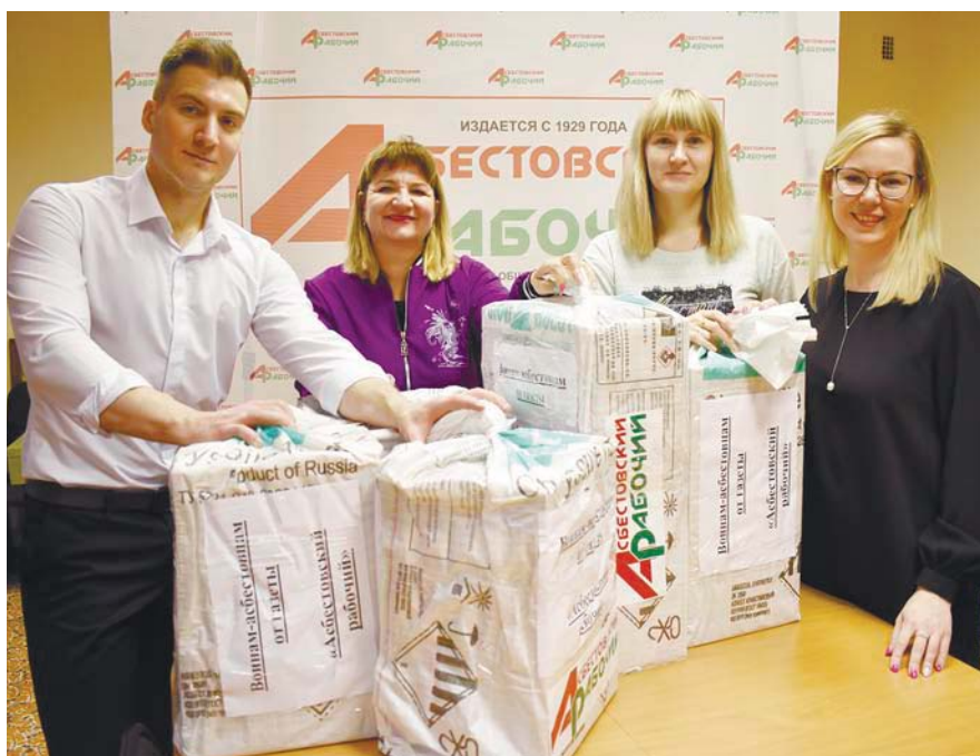
Коллектив редакции закупил необходимые вещи и продукты для отправки в зону СВО

Объявляя со страниц газеты сбор пустых банок, даже не предпола-