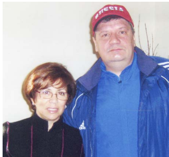
2008 год. С Ириной Родниной

зы нашего издания. Двадцать лет играл за коркинский «Шахтер» в чемпионате Челябинской области, потом 15 лет тренировал футбольный клуб «Первомайский», дважды приводив команду к званию по-