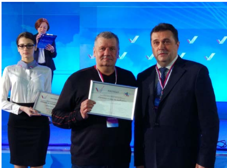
2018 год. Калининград. Награду вручает председатель СЖР Владимир Соловьев