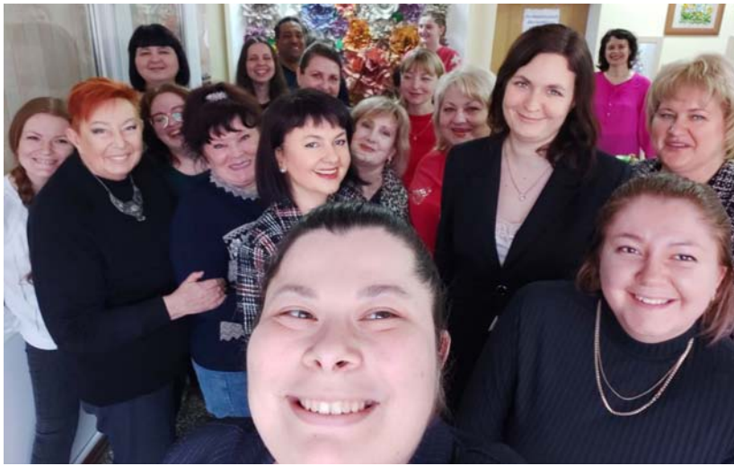
Коллектив «Шахтинских известий»