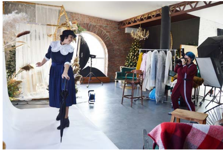
Съемки для проекта

Другим важным поворотом для развития проекта стала благотворительная фотосъемка «Искусство быть мамой», выросшая уже в отдельный проект. Впервые мы перевоплотили