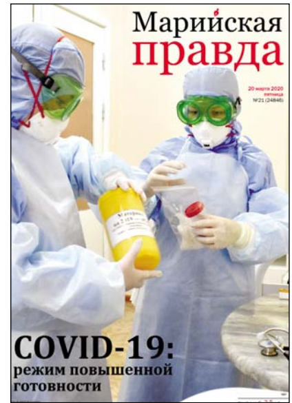
График прохождения материалов

режим. В таком формате мы выпускаем два номера в неделю «Марийской правды», два номера в месяц городской газеты и ежемесячную молодёжную газету.