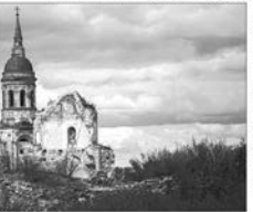
Церковь в селе Архангельске