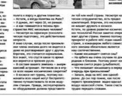
В Центре подготовки космонавтов Западного города негустой атмосферой. В Советском Союзе шансов на это почти не было, ведь надо было сначала стать летчиком, а потом — космонавтом.

Дело давно уже до того, что горожане выбрасывают дачные бани