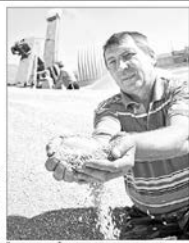
ВЕСЕЛЫЙ О ЗАРУБКАХ

Провинит ли себя Пензенская область, если не будет привозными продуктами?