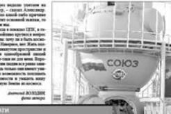
В Центре подготовки космонавтов Западного города негустой атмосферой. В Советском Союзе шансов на это почти не было, ведь надо было сначала стать летчиком, а потом — космонавтом.

— Не кажется ли вам, что Иркутск — это город, который не покинет землю? — Иркутск — это город, который не покинет землю. Он всегда будет с нами. Он всегда будет с нами. Он всегда будет с нами.