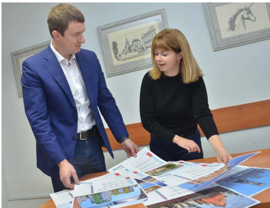
Выбираем макет календаря

читатели сдают нам макулатуру, мы её принимаем по 4 руб./кг — но не выдаём живыми деньгами, а делаем соответствующую скидку на подписку (сдал 20 кг, получил скидку 80 руб.) Собрано нынче 11 393 кг макулатуры, это 318 подписок. Акция прижилась в Березниках, нынче мы её по просьбам читателей даже продлили на месяц — обычно она действовала до сентября. Кроме того, сделали ответвление акции для школьников: «Зелёная подписка для ветеранов». Макулатуру собирают школы, сдают нам, а мы подписываем нуждающихся ветеранов. Сдали 150 кг = одна подписка, 300 кг = две подписки и т.д. Сейчас в этой акции участвуют две школы, ждём ещё участников.