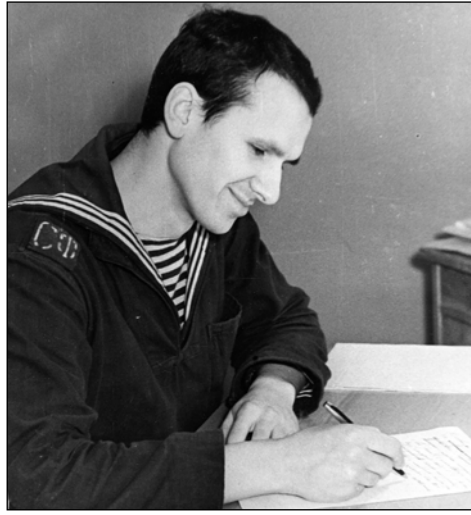
На флоте, «Океанская вахта». Первый год службы