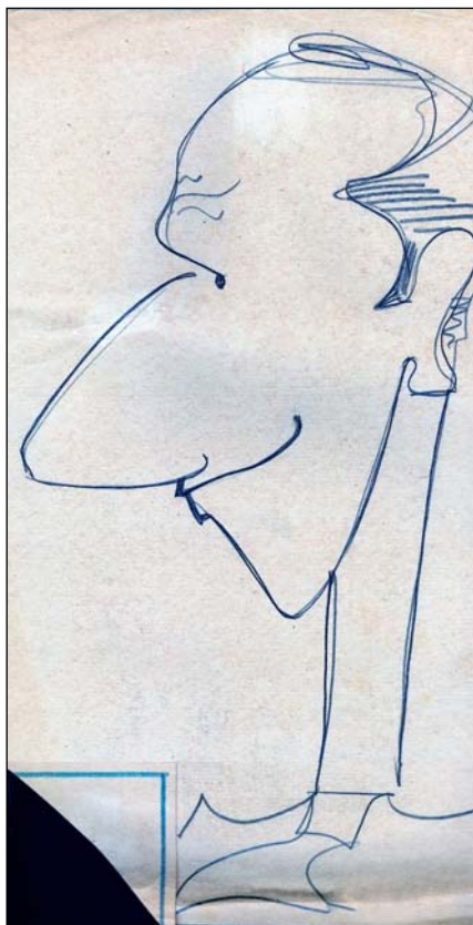
Дружеский шарж к публикации на литературной странице. Автора не помню, но он оставил на обороте рисунка замечательный автограф